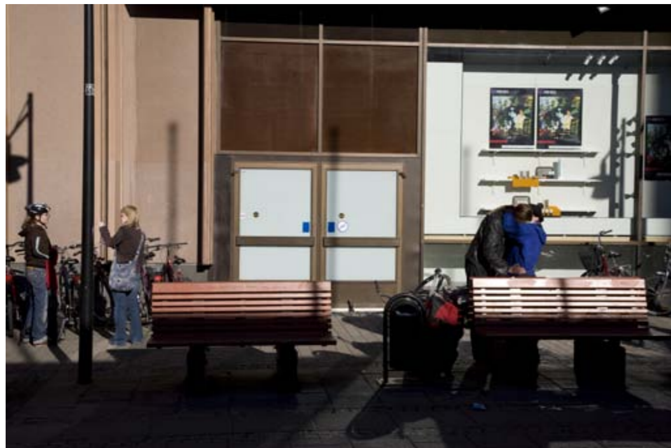
KOUZLO NEZÁVISLÝCH DĚJŮ. Na ulici probíhá bezpočet situací, přičemž je zvlášť zajímavé vidět mezi nimi nějaký kontrast, či je naopak vnímat jako autonomní děje sjednocené jen místem, časem, barevně stejnorodým pozadím...

Každodenní všední ruch ulice tvoří lidé, které se fotograf snaží zachytit buď v pohledech typických pro dané místo, nebo jako vyjádření svých vlastních pocitů z prostoru a okolního dění. Záleží na jeho naturelu a fotografických zkušenostech, jak je schopen se zorientovat, co dokáže vidět a co z celku zvýrazní.