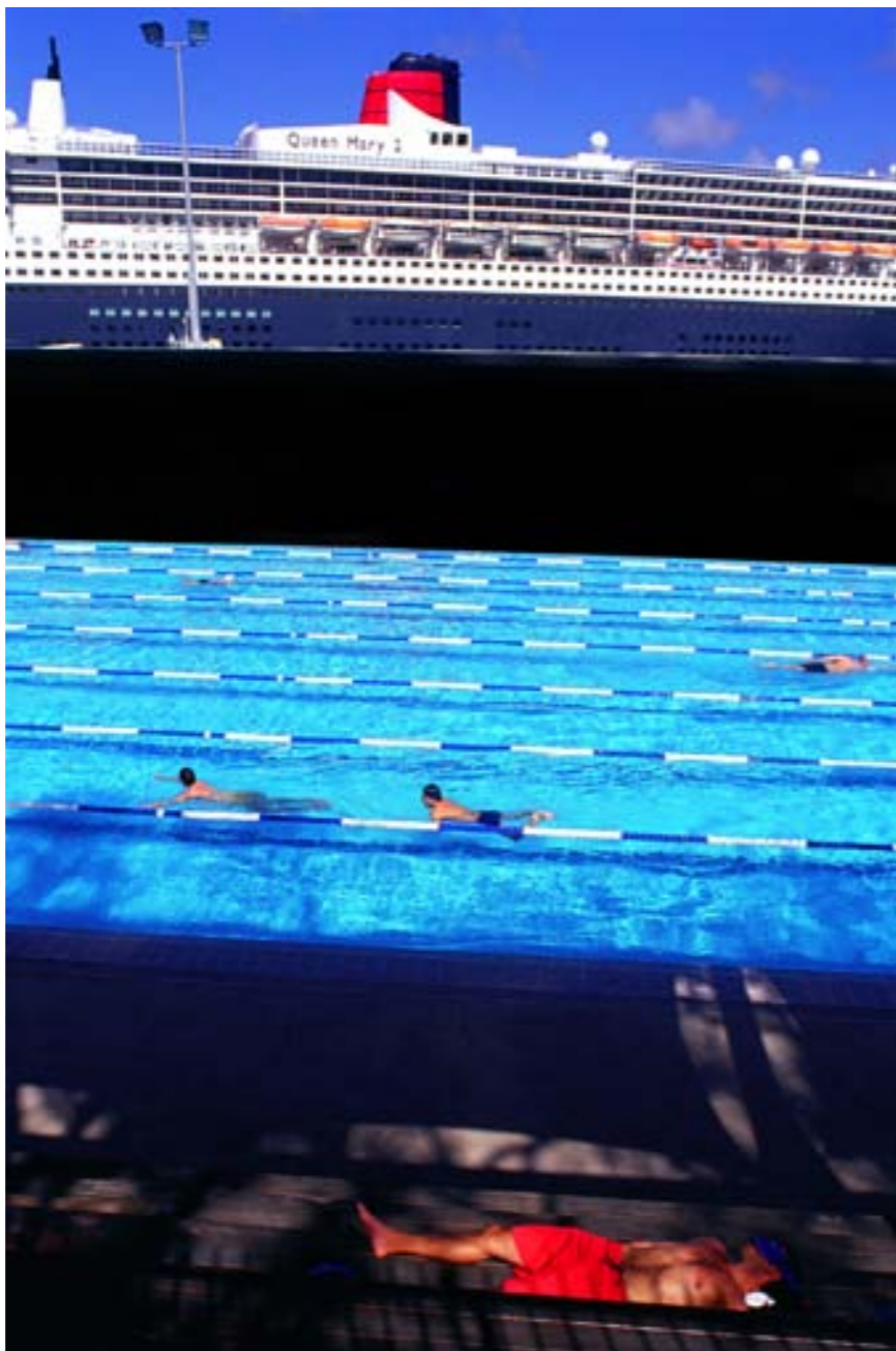
KONTRAST BAREV, KONTRAST DÉJŮ, KONTRAST HMOT... Skvělé „kulisovité“ rozčlenění prostoru. Sydney, 2007.

Fotograf nemá se svým přístrojem obtěžovat, neměl by ani budít zdání, že obtěžuje a že je indiskrétní. Požádání o souhlas s focením ovšem často vede k úplnému