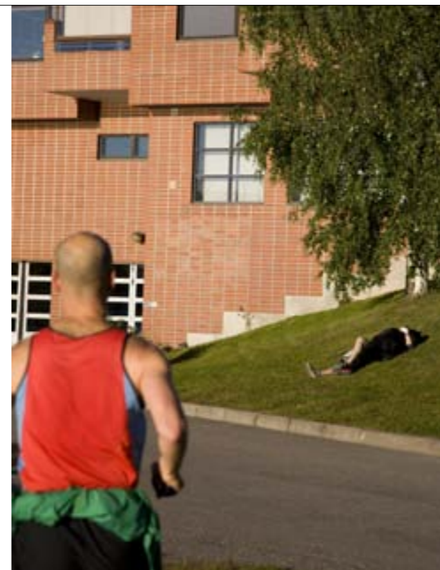
BIZARNÍ SOUHRA SITUACÍ A BAREVNÉ ŘEŠENÍ. Pokud se ulice fotí barevně, měl by být na fotografii nějaký vztah mezi barvami, které mohou zvýraznit prostor, přidat pocit kontrastu, dát náladu. Tampere.

Fotografovat dobře v městské džungli není jednoduché, a zvlášť těžko se fotí ulice „doma“, kde to známe. Fotograf může být ruchem okouzlen, ale taky zcela zahlcen. Častým úskalím bývá chaos v zobrazení. Ze snímku by mělo být jasné, proč byl vlastně pořízen, co je hlavním předmětem zobrazení, co vedlejšími prvky. Naše soustředění na motiv mohou využít zloději, které zve nápis na brašně. Ta se nenosí ledabyle přes rameno, a čím vypadá ošuntělejší, tím lépe. Naše fotografování se občas nemusí někomu líbit a dotýčný