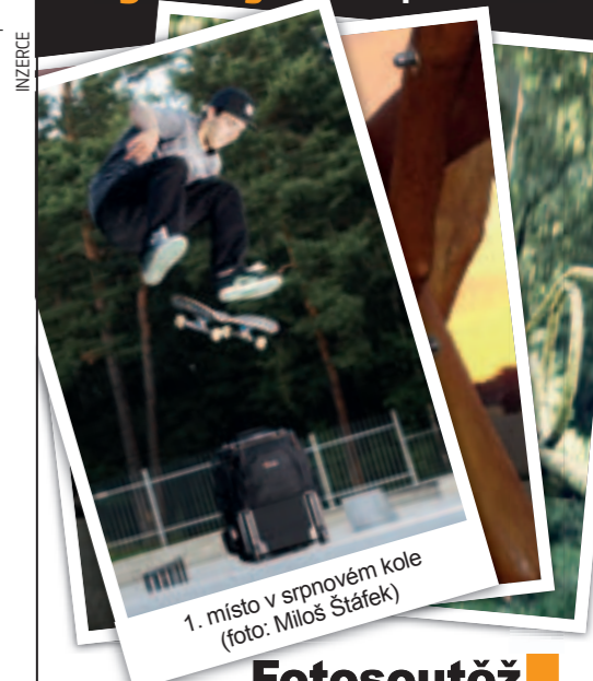
1. místo v srpnovém kole

technickou dokonalost, může využít malých nenápadných kompaktních. Z jejich nabídky bych pro tyto účely osobně dal přednost zejména takovým, které jsou vybaveny proti vodě, pádům a prachu, jmenovně například Canon PowerShot D10, Olympus Stylus Tough-8000, Panasonic Lumix DMC-FT2 a třeba i Pentax Optio W80 s velmi tenkým tělem.